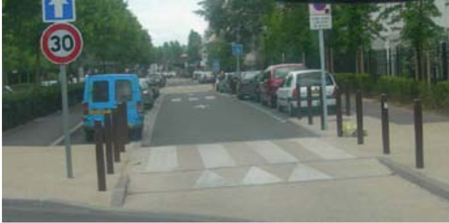
Rétrécissement formé par des avancées de trottoirs associées à une surélévation en entrée d'une zone 30