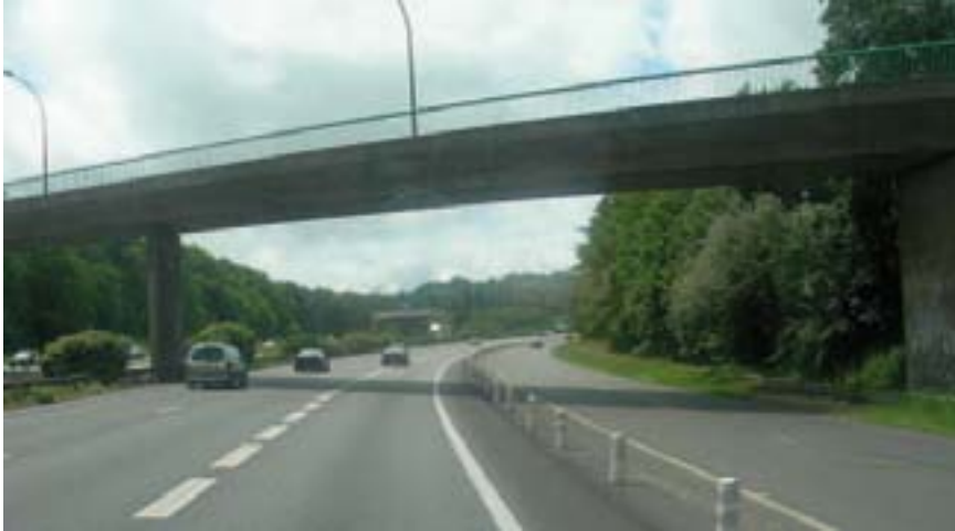
Dans le cas d'appuis le terre-plein central et les accotements.