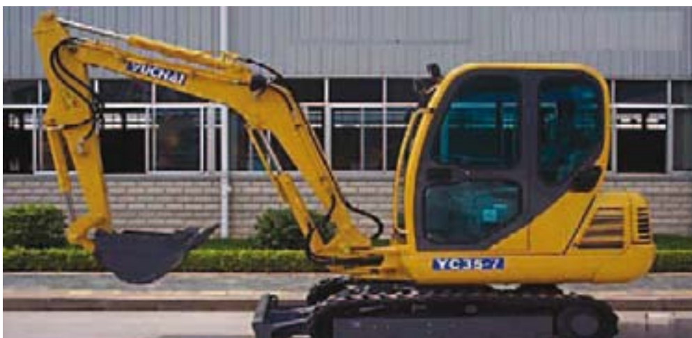
Une pelle mécanique

Le remblayage et le compactage sont effectués par compacteurs vibrants, plaques vibrantes et pilonneuses. Le type d'engin à utiliser est défini selon le type de matériau à découper ainsi que la largeur de la tranchée.