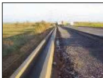
Exemples de caniveaux