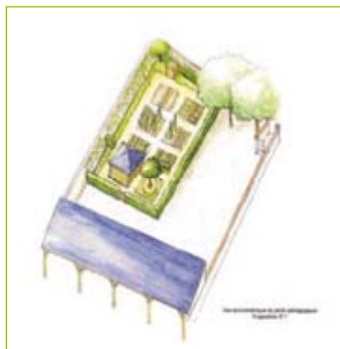
Exemples de croquis d'ambiance relatifs au plan masse ci-dessus