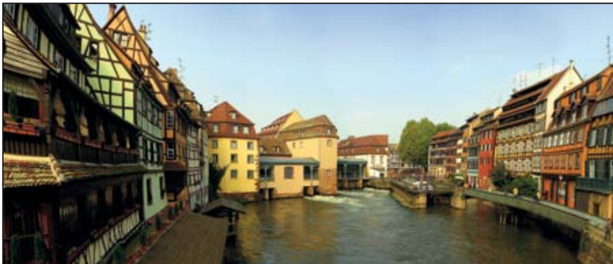
« Petite-France » à Strasbourg

Région : Alsace Département : Bas-Rhin N48 34 53 E7 45 0*